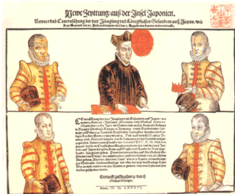
Quattro ambasciatori giapponesi