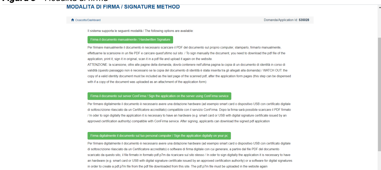
Figura 6 – Modalità di firma

Negli altri casi, vengono proposte tre modalità di firma: il candidato deve selezionarne una e seguire attentamente le istruzioni (fig. 6)