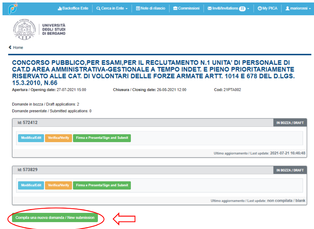
Figura 4 – Inizio procedura di inserimento domanda.

La domanda è suddivisa in sezioni/pagine.