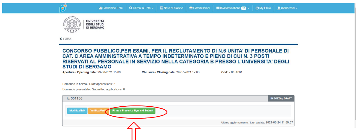
Figura 5 – Presentazione della domanda.

Per presentare la domanda si dovrà cliccare su "Firma e Presenta/Submit" (fig. 5)