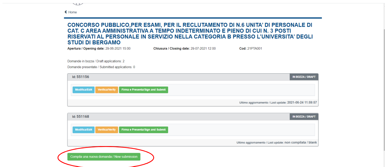
Figura 4 – Inizio procedura di inserimento domanda.

La domanda è suddivisa in sezioni/pagine.